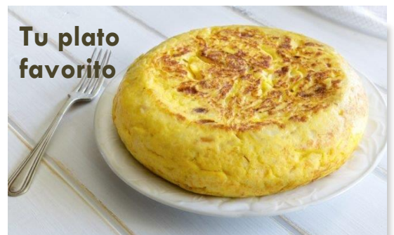
Tu plato favorito