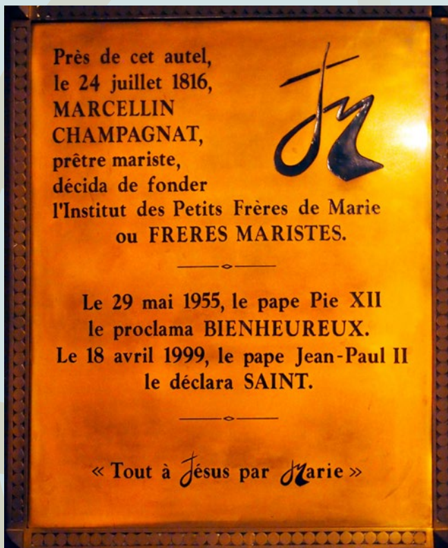
Placa conmemorativa en la Capilla de N. Sra. de Fourvière.