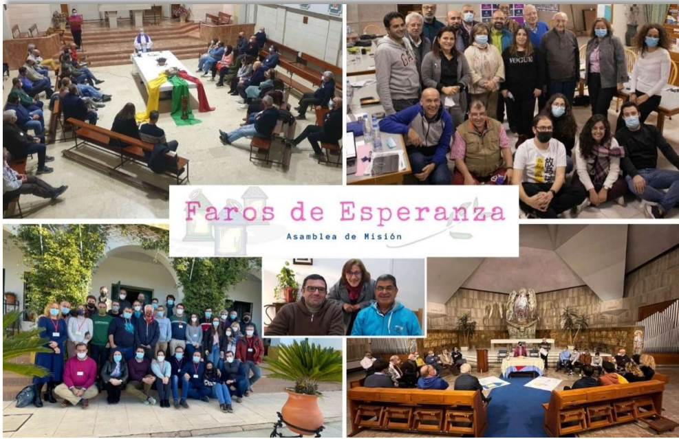
Fotomontaje con las cinco sedes en España, Líbano, Italia y Siria donde se celebró la Asamblea Provincial de Misión de Maristas Mediterránea.