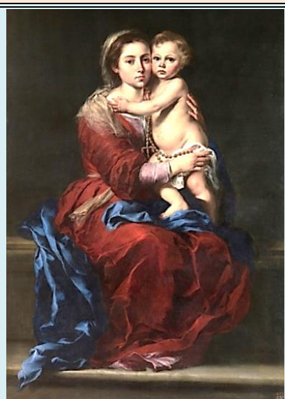
Tableau: La Vierge du Rosaire Auteur: MURILLO, Bartolomé Esteban Date: 1650-1655 Matériaux: Huile sur toile Dimensions: 166 cm x 112 cm. Lieu: Musée du Prado (Madrid).

Le rosaire, dans son ordination actuelle, est assez postérieur. Il est possible que sa structure commença par la récitation des 150 pater noster quotidiens des moines 'legs' (ou moniales) chargés des travaux manuels.