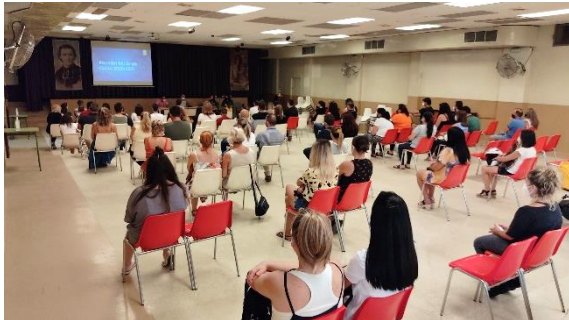
Réunion parents de Maternelle 3 ans.