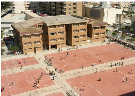
Collège Mariste de Cullera et son ample zone sportive.

Finalement, c'est notre désir d'inviter tous les gens du village à jouer du football en salle et appuyer ce nouveau chemin. Du club nous espérons la réponse positive des joueurs, ainsi que l'appui de la Mairie et des Institutions pertinentes. Avant.