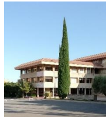
Le cyprès admiré des maristes

Quirónsalud Alicante recevra des consultations virtuelles d'urgences médicales avec le collège Mariste d'Alicante. Grâce à ces consultations virtuelles, pionnières dans la zone alicantine au service de l'infirmier du centre éducatif il pourra contacter en temps réel avec le médecin des urgences pédiatriques de Quirónsalud Alicante et traiter toutes les doutes en relation à l'état de santé de ses élèves et en cas nécessaire être portés au centre hospitalier pour recevoir attention médicale.