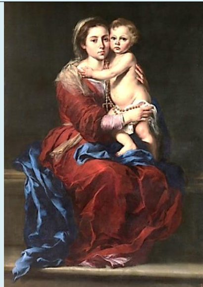
Quadro: La Vergine del Rosario Autore: MURILLO, Bartolomé Esteban Data: 1650-1655 Materiale: Olio su tela Dimensioni: 166 cm x 112 cm. Luogo: Museo del Prado (Madrid)

Il rosario, nel suo attuale ordinamento, è molto più posteriore. Forse la sua struttura è iniziata con la preghiera dei 150 Padre Nostro quotidiani dei monaci 'laici' (o suore) impegnati nel lavoro manuale.