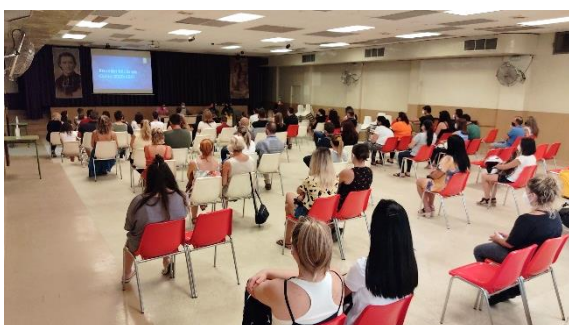
Incontro dei genitori dei bambini di tre anni.

Equipe del Consiglio dell'Opera – Maristi Cordova