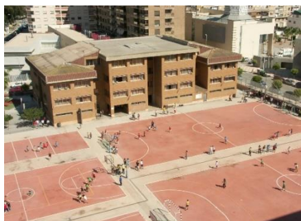
Scuola Marista di Cullera e la sua ampia zona sportiva.