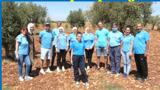
Equipe 'Colibrì' dei Maristi Blu

L'equipe Colibrì dei Maristi Blu continua la sua missione nell'accampamento di Shahba per profughi con la sua clinica medica e la distribuzione di ceste di alimenti e di materiali igienici.