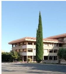
L'ammirato cipresso dei maristi

Al fine di promuovere abitudini di vita sane e risolvere i dubbi sul Covid-19 nell'infanzia e nell'adolescenza, specialisti di Quirónsalud Alicante terranno webinar di formazione nella Scuola "Sagrado Corazón Alicante" dei Maristi per il personale docente, genitori e alunni nei quali saranno trattate tematiche di rilevanza come l'importanza di una dieta equilibrata per evitare l'obesità infantile, il sonno o per informare su una corretta igiene dentale.