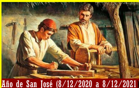
Año de San José (8/12/2020 a 8/12/2021)